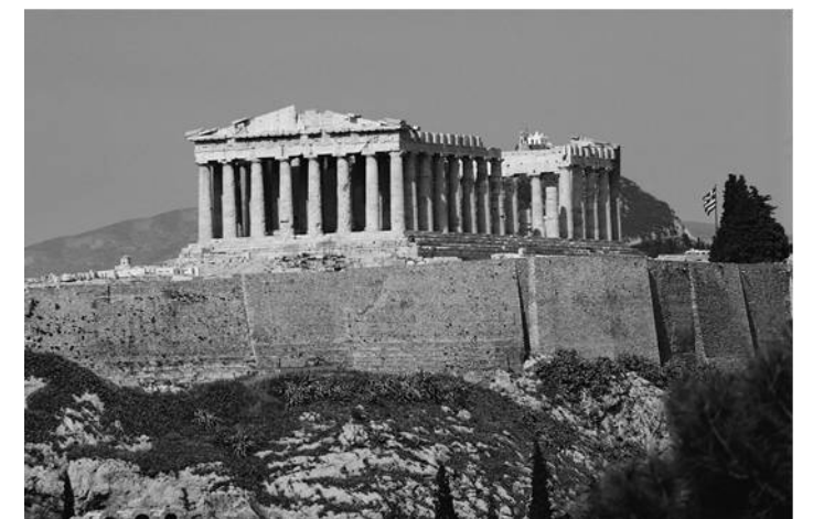
De Griken hawwe net allinne ús architektuer beynfloede, mar ek ús godsbyld

Ik haw ris neigien, wêr oft yn de bibel God de 'Almachtige' neamd wurdt. Dat is in kear as wat yn it boek Genesis; hiel faak yn it boek Job; yn it NT hast net, útsein yn it boek Iepenbiering. Mar it is hiel opfallend, dat Jezus noait oer God praat as 'de Almachtige'. As wy nei de Hebrieuske grûntekst sjogge, dan fine wy dêr it wurd der El Sjadj . El betjut 'God'. Sjadaj is yn de Septuaginta, de âlde Grykske oersetting fan de hebrieuske bibel troch in tal joadske gelearden út de 3 e ieu foar Kristus, oerset mei Pantokrator . Letterlik betsjut dat 'hearsker oer alles'.