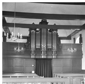
It oargel yn de tsjerke fan Earnewâld

De tagong is fergees; by de útgong is der in kollekte foar de ûnkosten.